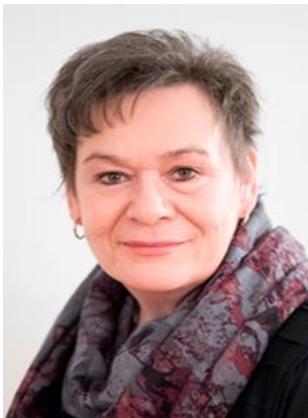
Barbara Wyss Pflegedienst